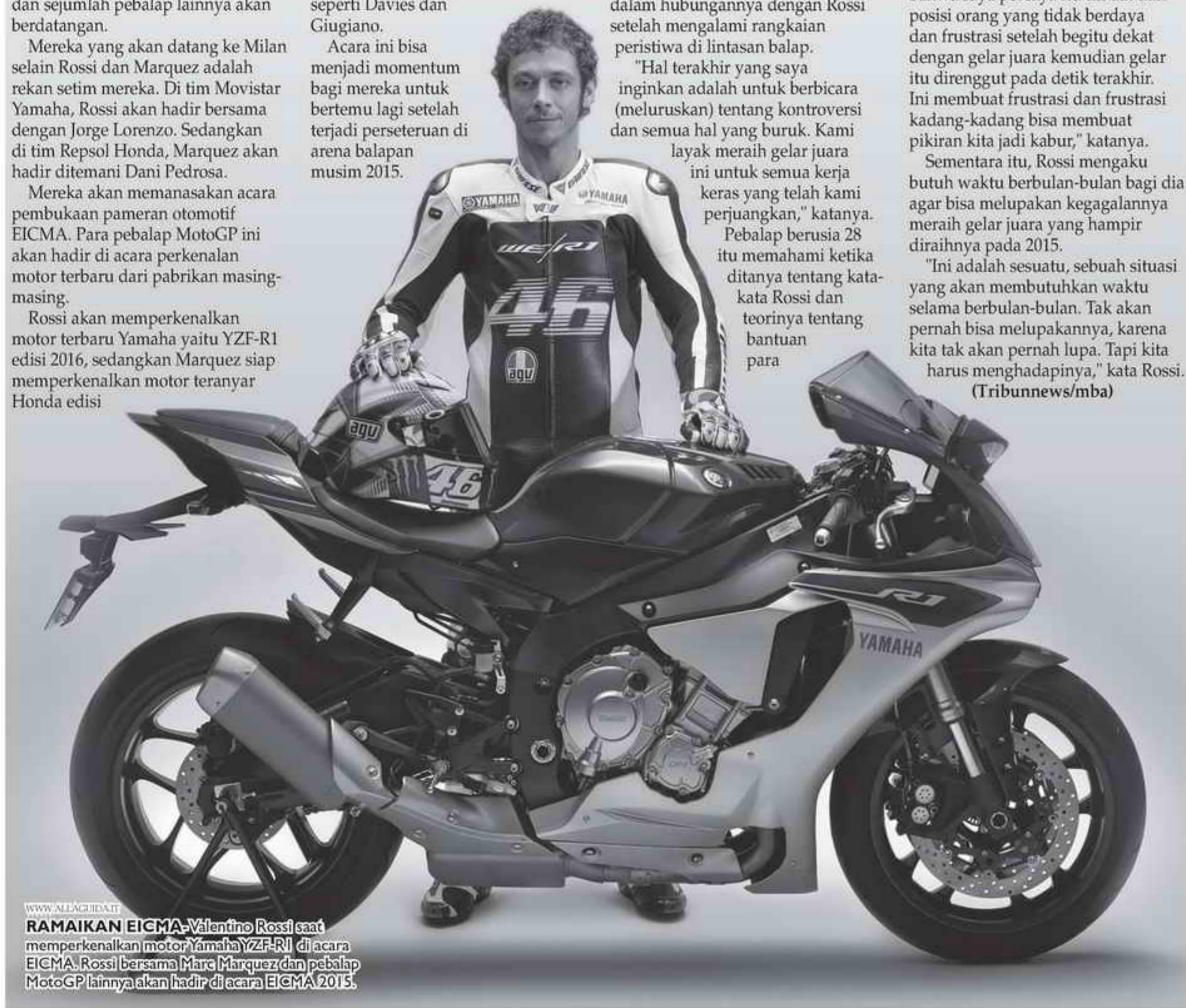
RAMAIKAN EICMA-Valentino Rossi saat memperkenalkan motor Yamaha YZF-R1 di acara EICMA. Rossi bersama Marc Marquez dan pebalap MotoGP lainnya akan hadir di acara EICMA 2015.